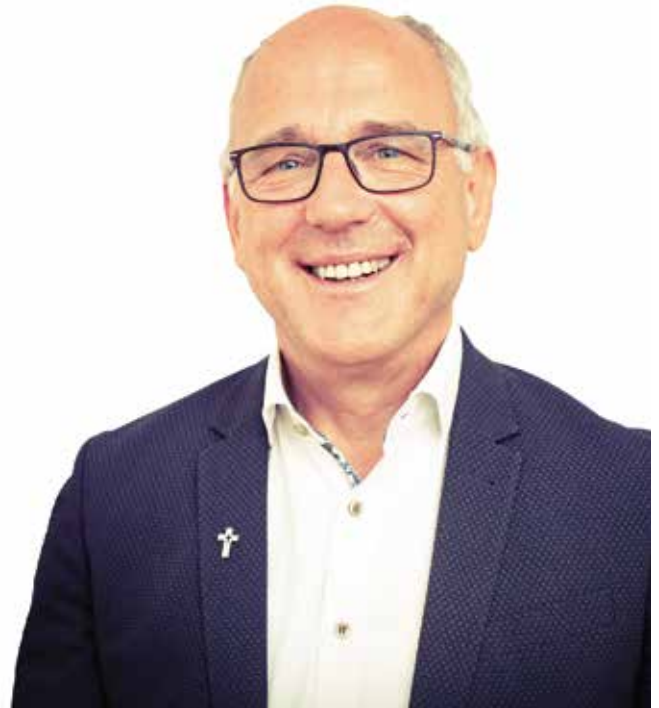
Presstext: Erzbistum Freiburg & PRef Manfred E. Fischer / Foto: Manfred E. Fischer – Pressebild darf lizenzfrei veröffentlicht werden

Alle Infos zur Errichtung der Dekanate und der Ernennung der 6 Pfarrer gibt es auf www.ebfr.de und auf www.dekanat-linzgau.de .