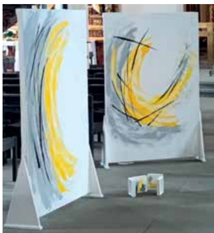
Fotos: Klaus Tischer: Foto 1, 2: Im Arbeitsprozess, Foto 3: Markus Seeger, Anne-Marie Sprenger