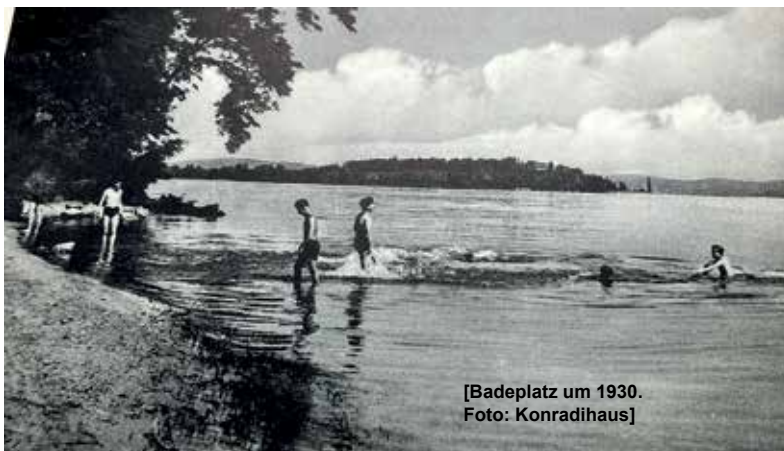
[Badeplatz um 1930. ]