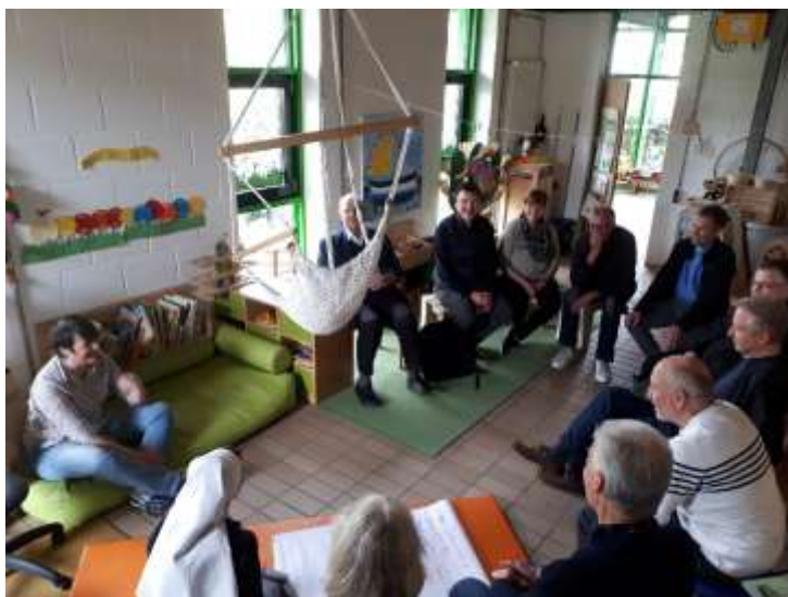
Bild rechts: Hauptamtliche Mitarbeiter*innen der Pfarrei Neu „Hegau Ost“ bei der Frühjahrskonferenz in Litzelstetten

Anmeldung zum Newsletter auf der Homepage www.kath-hegau-ost.de