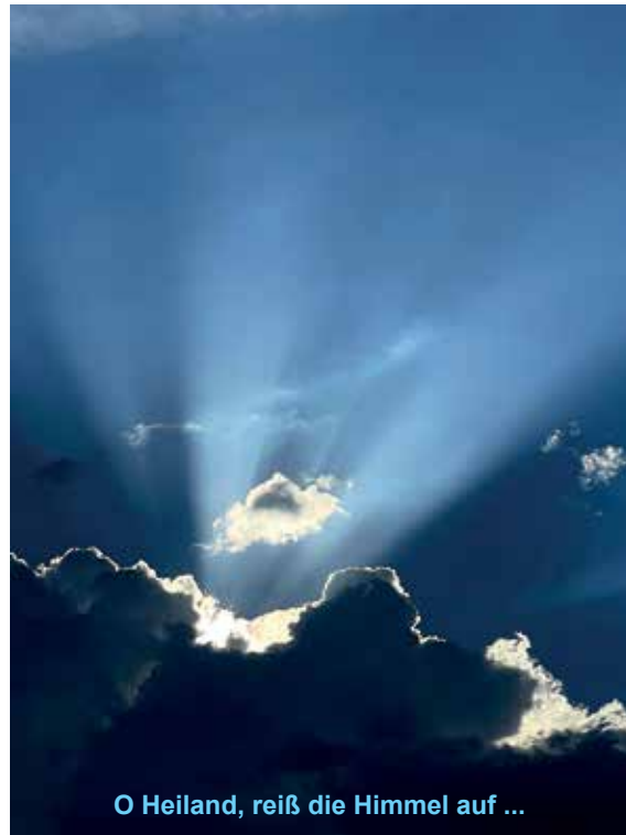
O Heiland, rei die Himmel auf ...

vorweihnachtliche Zeit ersetzt worden. Die Menschen hetzen auf der Suche nach Weihnachtsgeschenken durch die überfüllte Stadt, vor dem Fest muss auf der Arbeit möglichst alles wichtige zum Abschluss gebracht werden, während man gleichzeitig