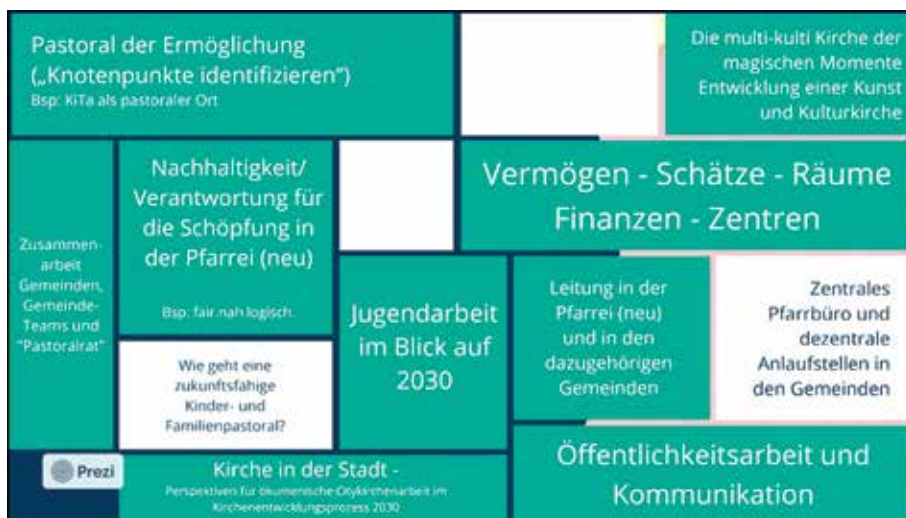
Erste Themenschwerpunkte für zukünftige Arbeitsgruppen im Projekt der Kirchenentwicklung 2030.

„Vertreter*innen der Ursprungsorganisationen“ war der technische korrekte Ausdruck, mit dem aber genau genommen einfach Engagierte aus den Pfarrgemeinderäten, hauptamtliche Mitarbeiter*innen in verschiedenen pastoralen Feldern, Vertreter*innen aus Bildungseinrichtungen und Caritasverbänden, Klöstern, Religionslehrer*innen, Erzieher*innen gemeint sind. Sie alle konnten sich in dieser ersten großen Zusammenkunft im Hinblick auf die Kirchenentwicklung 2030 wahrnehmen und erleben, dass es doch immer noch einige Menschen gibt, die sich für die Zukunft der Kirche in unserer Gegend einsetzen wollen.