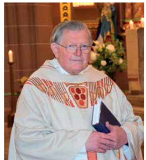
Goldene Primiz in Forbach

Bis zu seinem Ruhestand 2005 wirkte er als Pfarrer in Gailingen. Die Gläubigen von St. Stephan danken ihrem letzten Pfarrer für seinen Dienst. Möge er im „himmlischen Jerusalem“ Vollendung finden.